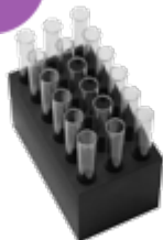
B18-12 18 гнезд Ø 12 мм глубиной 58 мм