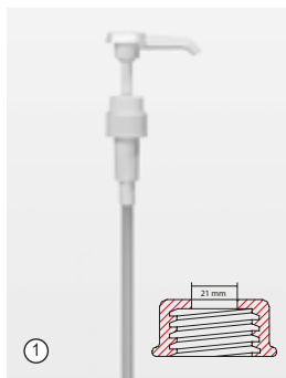
① «Доси-Памп» (Dosi-Pump), 4 мл Стандартное дозирование примерно 4 мл/такт.