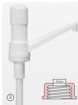
③ «Доси-Памп» (Dosi-Pump), 30 мл, устойчивый слив Стандартное дозирование примерно 30 мл/такт, с устойчивым сливом.