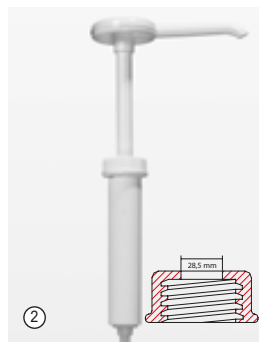
② «Доси-Памп» (Dosi-Pump), 30 мл Стандартное дозирование примерно 30 мл/такт.