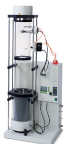
Nano Spray Dryer В-90

Лучшая в мире лабораторная распылительная сушилка