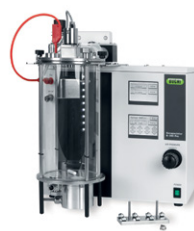
Encapsulator В-395 Pro

Распылительная сушилка для образцов небольшого объема и частиц