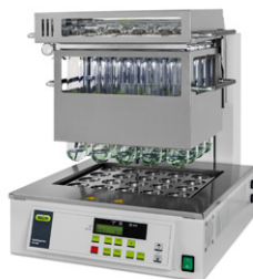
KjelDigester К-446 / К-449 Блочная минерализация