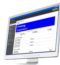
KjelLink PC software Управление данными