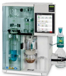
KjelMaster К-375 Паровая дистилляция и титрование