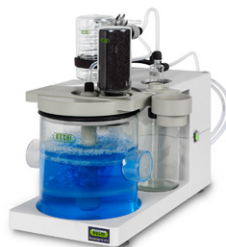
Scrubber К-415 Нейтрализация