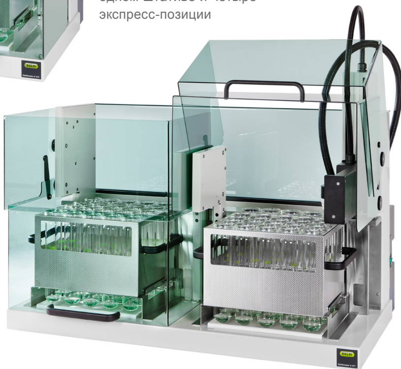
KjelSampler K-377 48 позиций для проб на двух штативах и восемь экспресс-позиций

20 позиций для проб на одном штативе и четыре экспресс-позиции