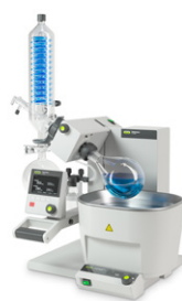
Rotavapor® R-300 Удобное и эффек- тивное ротацион- ное упаривание