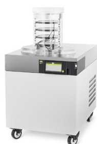
Lyovapor™ L-300 Первый прибор для непрерывной лиофильной сушки в лаборатории