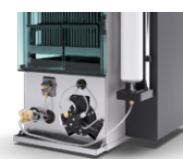
Pure Chromatography Systems Соответствие вашим потребностям