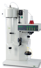
Mini Spray Dryer B-290 Лучшая в мире лабо- раторная распыли- тельная сушилка